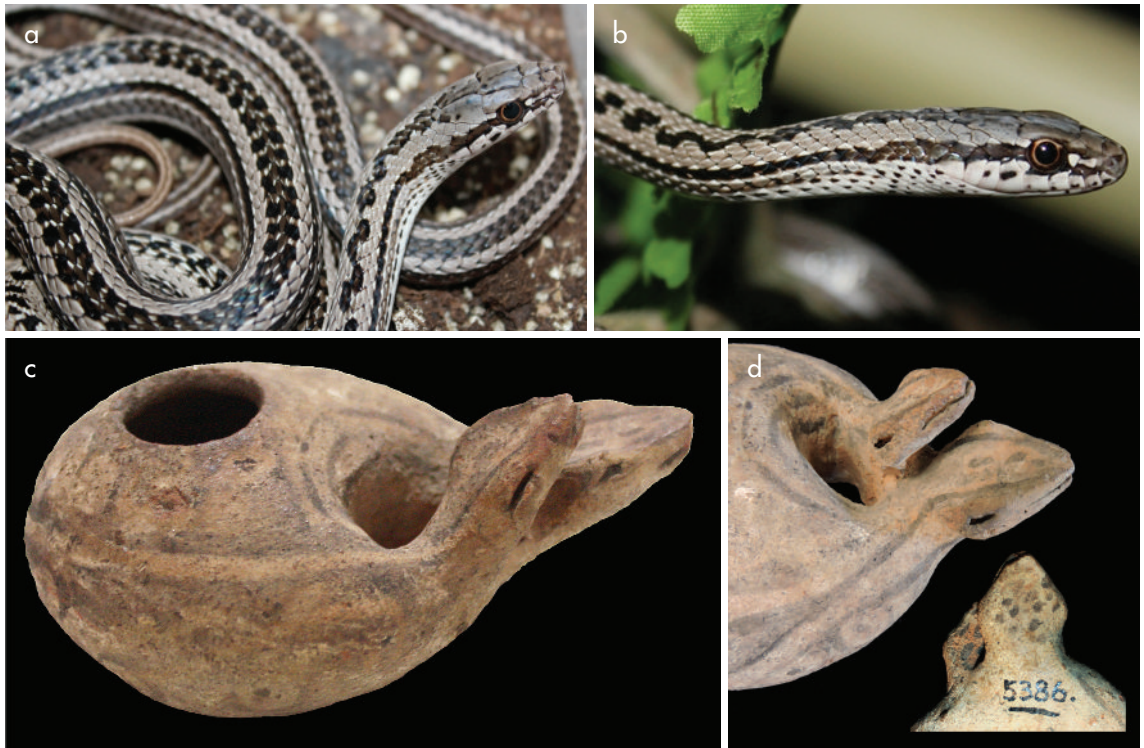
Figura 7. Vistas de la pieza MLP-AR-(n)5386 y de ejemplares vivos de Philodryas psammophidea en los que puede observarse la repetición de un patrón semejante de rayas y manchas. (Fotografías: a-b) Johannes Marchand; c-d) de los autores). Figure 7. Pictures of living Philodryas psammophidea , showing the reiterated lines-and-spots pattern, and two views of the vessel MLP-AR-(n)5386 (Photos: a-b) Johannes Marchand; c-d) the authors).

En cambio, la ausencia de fosetas y de colmillos visibles y la presencia de un patrón de manchas y rayas dorsolaterales a lo largo de todo el cuerpo e incluso en la cabeza, pueden observarse en ejemplares de Philodryas psammophidea . Vulgarmente conocida como “culebra rayada”, esta especie se caracteriza por poseer un cuerpo delgado y estilizado, vientre amarillento o rosado y coloración dorsal gris claro con bandas longitudinales castaño oscuro, separadas por áreas claras a modo de bandas que recorren los flancos del cuerpo (Leynaud & Bucher 1999: 31) (fig. 7).