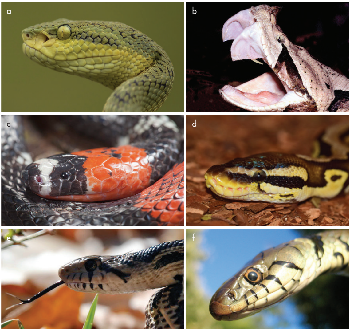
Figura 6. Región cefálica de ofidios de familias presentes en Argentina: a-b) Viperidae , con foseta loreal, pupila vertical y grandes dientes inoculadores de veneno; c) Elapidae , con cabeza poco diferenciada del cuerpo y coloración anillada característica; d) Boidae , con cabeza alargada y fosetas labiales; e-f) Colubridae , con pupila circular. Figure 6. Heads of ophidia families present in Argentina: a-b) Viperidae , with loreal pit, vertical pupil, and large venom-delivery fangs; c) Elapidae , with undifferentiated head and body and typical colored rings; d) Boidae , with elongated head and labial pits; e-f) Colubridae , with circular pupil.

de la llamativa pupila vertical que poseen los vipéridos (yararás y cascabeles). La ausencia de fosetas sensitivas en ambas cabezas resultó igualmente diagnóstica, ya que no aparecen representadas o sugeridas ni las características fosetas loreales de los vipéridos ni las fosetas labiales propias de las boas. Por otro lado, la boca está representada como una incisión relativamente corta y no se observa ningún tipo de rasgo modelado o pintado