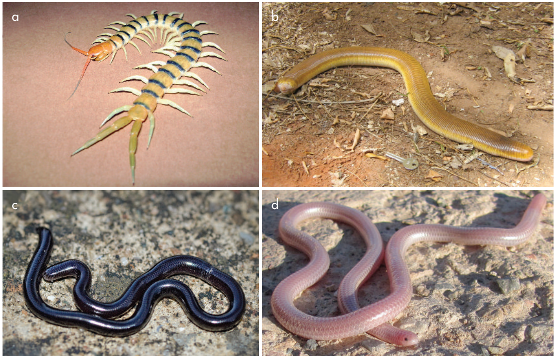
Figura 3. Diversos especímenes cuyo aspecto remite al de animales de dos cabezas: a) escolopendra; b) anfisbena; c-d) pequeños ofidios de vida subterránea.. Figure 3. Species similar in appearance to the two-headed ceramic figure: a) scolopendra; b) anphibena; c-d) small burrowing ophidia..

de Arqueología y Antropología, San Pedro de Atacama (Horta com. pers. 2017), y se ha propuesto que podrían provenir del Noroeste Argentino (Tarragó 1989). Hasta donde se tiene registro, no existe otra pieza de características semejantes en las colecciones del Museo de La Plata. Solo un pequeño fragmento cerámico perteneciente a la colección Moreno, que presenta dos cabezas de ofidio modeladas que divergen aparentemente de un mismo cuerpo, podría constituir una excepción en tal sentido, pero lamentablemente el grado de deterioro que presenta la pieza impide lograr una identificación sistemática y obtener mayores detalles.