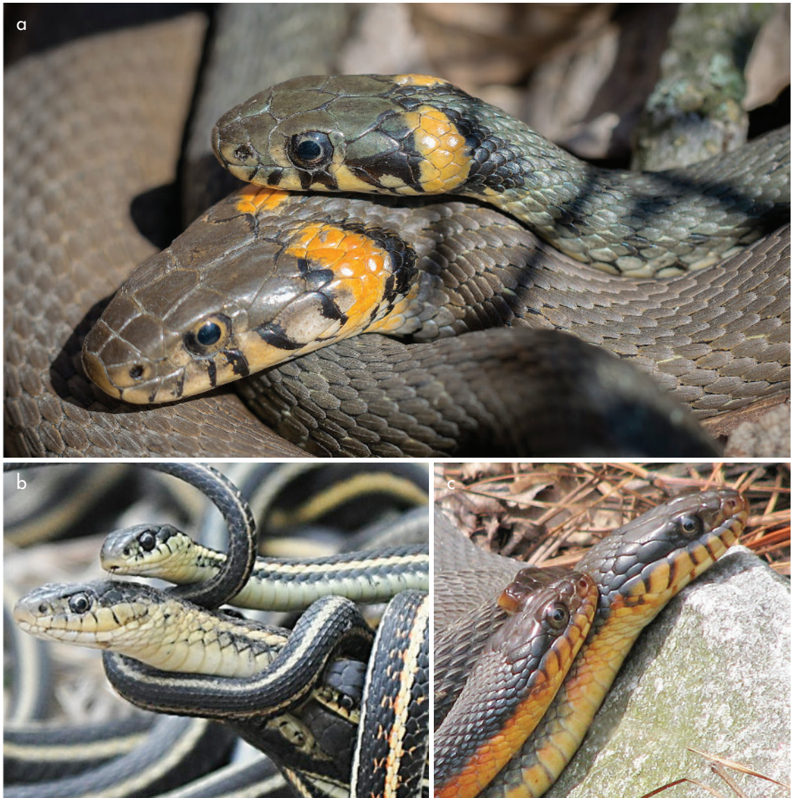
Figura 4. Culebras en apareamiento. Nótese que el macho es de menor tamaño, situación frecuente en la familia Colubridae. (Fotografías: a) de uso libre; b) Oregon State University; c) Vicki DeLoach). Figure 4. Snakes mating. Note that the male is smaller, as is frequently the case with the Colubridae family. (Photos: a) public domain; b) Oregon State University; c) Vicki DeLoach).

ciones de serpientes con dos cabezas corresponden a animales míticos o fantásticos, el nacimiento y desarrollo de serpientes con dos cabezas es un hecho registrado en la naturaleza, aunque tales cabezas nunca se encuentran ubicadas en extremos opuestos del cuerpo del animal. Tal condición, denominada dicefalismo o somatodicotomía, puede ocurrir como resultado de alteraciones del desarrollo embrionario, cambios en la temperatura durante el tiempo de incubación,