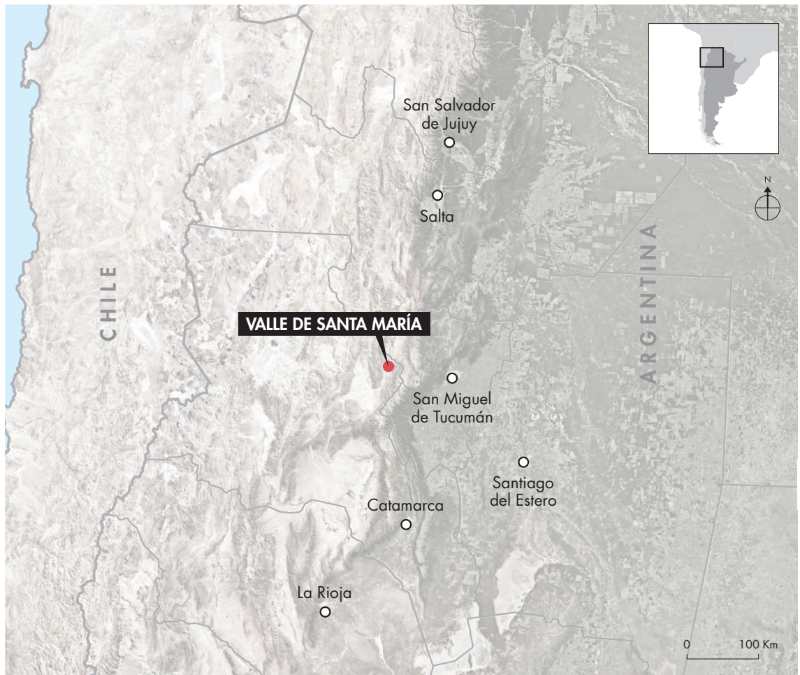
Figura 1. Detalle de la ubicación del Valle de Santa María en la Provincia de Catamarca, en el Noroeste de la República Argentina. Figure 1. Map showing location of the Santa María Valley in Catamarca Province, Northwest Argentina.