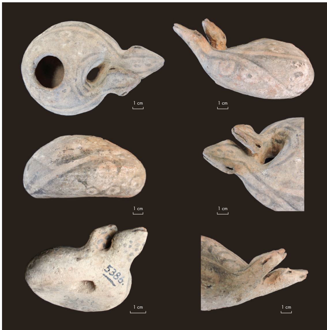
Figura 2. Seis vistas de la pieza. Nótese el diseño que la ornamenta y la forma y posición relativa de las cabezas. Figure 2. Six views of the piece. Note the decorative design and shape and the relative position of the two head.

2,17 cm. La superficie de la pieza presenta decoración pintada en blanco y negro, con un diseño de dos rayas negras de unos 2 a 3 mm de ancho, que se extienden por la circunferencia de la pieza y hasta las cabezas de los animales. A los lados de las rayas se observan pequeños círculos concéntricos pintados en tonos de negro, de unos 8 mm de diámetro, los externos más claros y los internos más oscuros. La base del recipiente no está ornamentada, pero sí la cara ventral de ambas cabezas,