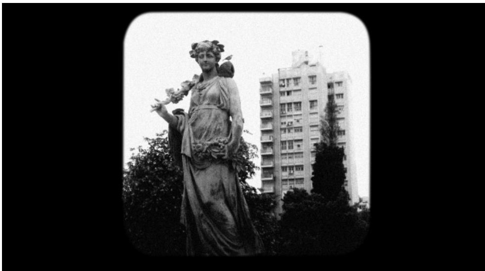
Figura 4. Un pájaro y su nido encima de la escultura El otoño , en Plaza Moreno

En este segundo momento, los planos progresan pero también dialogan, algunos de forma directa, otros en forma de eco. Una ciudad en movimiento 4 estática, donde lo que primero se mueve son las nubes y el agua que queda en las calles luego de la tormenta. Los reflejos, rotados e invertidos en edición, revelan una ciudad dada vuelta. Las esculturas que muestran figuras humanas detenidas, náufragos de un proyecto de ciudad. 5 Los pájaros, únicos con posibilidad de volar y de resguardarse de la superficie, se posan en ellas ignorando su valor y observando el paisaje urbano [Figura 4]; las aguas se retiran dejando el vacío hasta llegar al tacho de basura final, con la cerradura que da cierre al cortometraje pero que también clausura de forma irónica con el lema ciudad para todos . 6