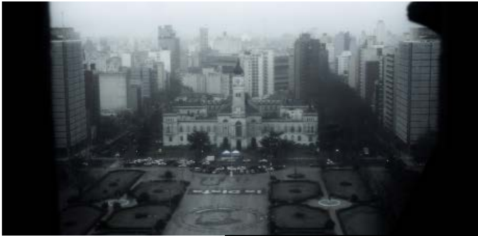
Figura 3. Primer plano visible en Calle 52

En este segundo momento, los planos progresan pero también dialogan, algunos de forma directa, otros en forma de eco. Una ciudad en movimiento 4 estática, donde lo que primero se mueve son las nubes y el agua que queda en las calles luego de la tormenta. Los reflejos, rotados e invertidos en edición, revelan una ciudad dada vuelta. Las esculturas que muestran figuras humanas detenidas, náufragos de un proyecto de ciudad. 5 Los pájaros, únicos con posibilidad de volar y de resguardarse de la superficie, se posan en ellas ignorando su valor y observando el paisaje urbano [Figura 4]; las aguas se retiran dejando el vacío hasta llegar al tacho de basura final, con la cerradura que da cierre al cortometraje pero que también clausura de forma irónica con el lema ciudad para todos . 6