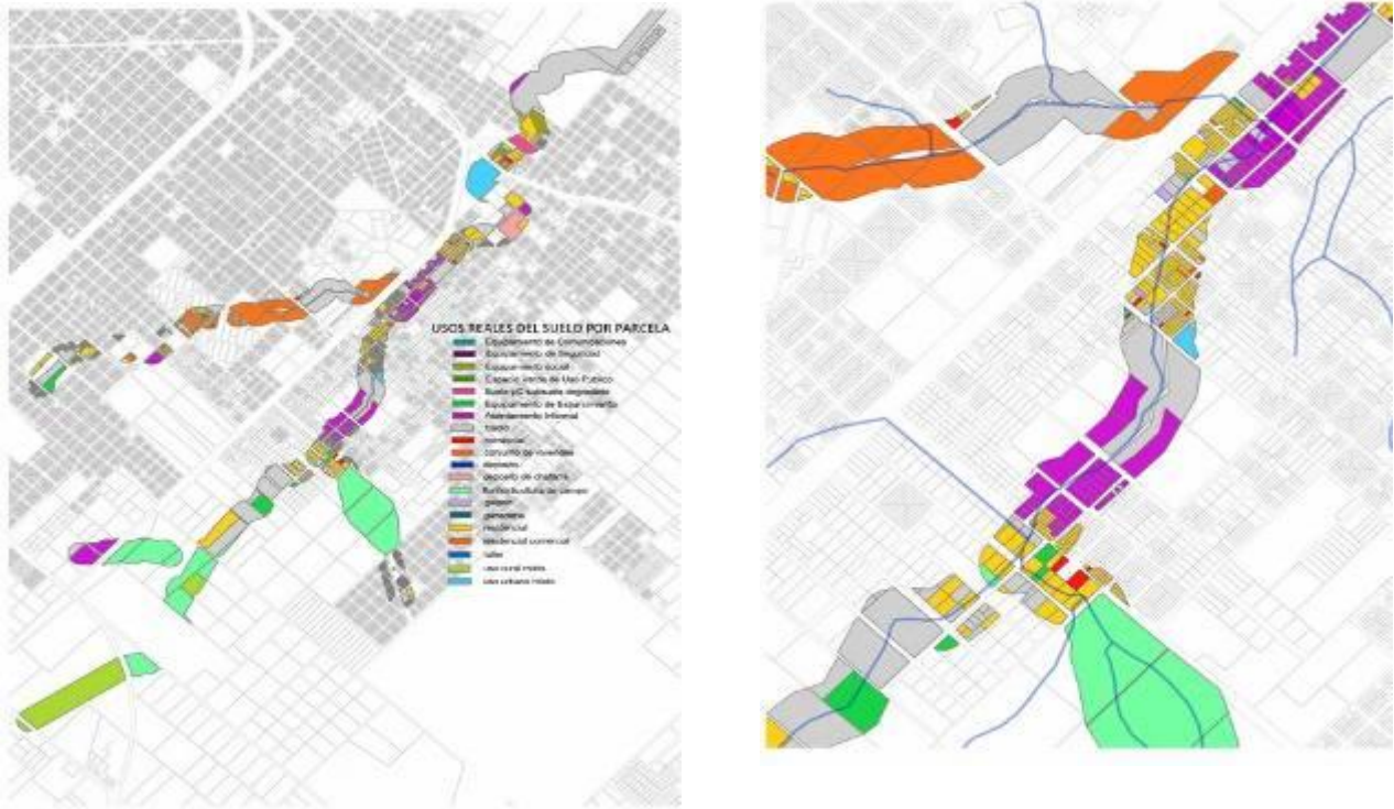
Figura N° 6. Uso real del suelo en las márgenes del Arroyo Maldonado