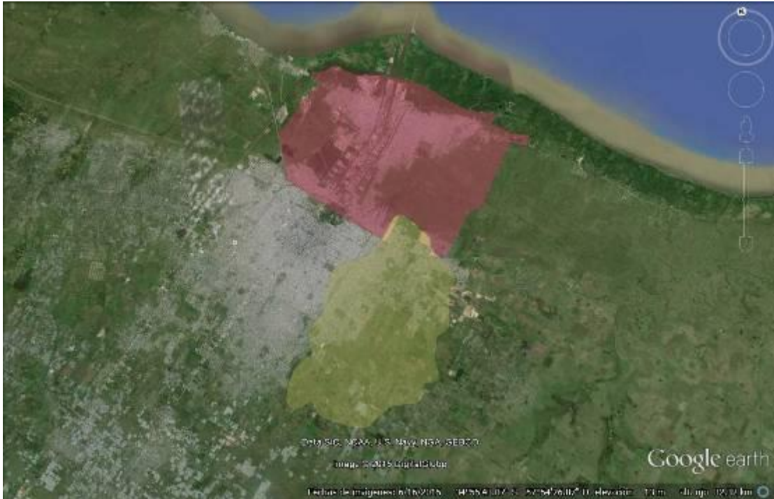
Figura N° 1. Los dos sectores de análisis, se observa en rojo el área comprendida por los canales de Berisso y Ensenada y en amarillo la zona de la cuenca del arroyo Maldonado