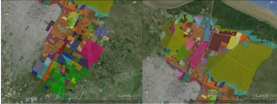
Figura N° 9. Delimitación de los “Pre-lugares” en los Sectores de los Canales de Berisso y Ensenada y de la Cuenca del Arroyo Maldonado

A partir de la definición de estos “pre-lugares” se procedió luego, como parte del momento 5 , a la realización del mapa temático con los límites de los mismos (Figura N° 9).