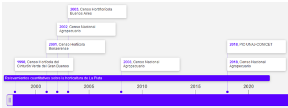
FIGURA 1 Línea de tiempo de relevamientos cuantitativos disponibles sobre la horticultura de La Plata (1995-2020).