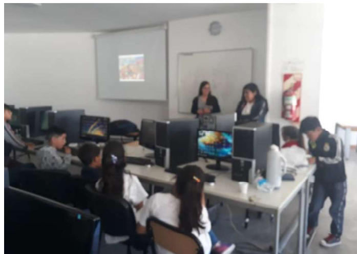
Fig. 8. Estudiante de la comunidad Nam Qom exponiendo el desarrollo de la leyenda

En la III Jornada de Programación Infantil realizada en el mes de octubre del año 2019, los y las estudiantes de la Asociación Nam Qom contaron con un espacio en donde pudieron mostrar a sus pares el desarrollo que habían realizado durante el año. Una de las estudiantes (fig. 8), integrante de la comunidad Qom, explicó y expuso el desarrollo de la simulación frente al resto de niños, niñas y jóvenes de las restantes asociaciones civiles sin fines de lucro que estaban participando de la jornada.