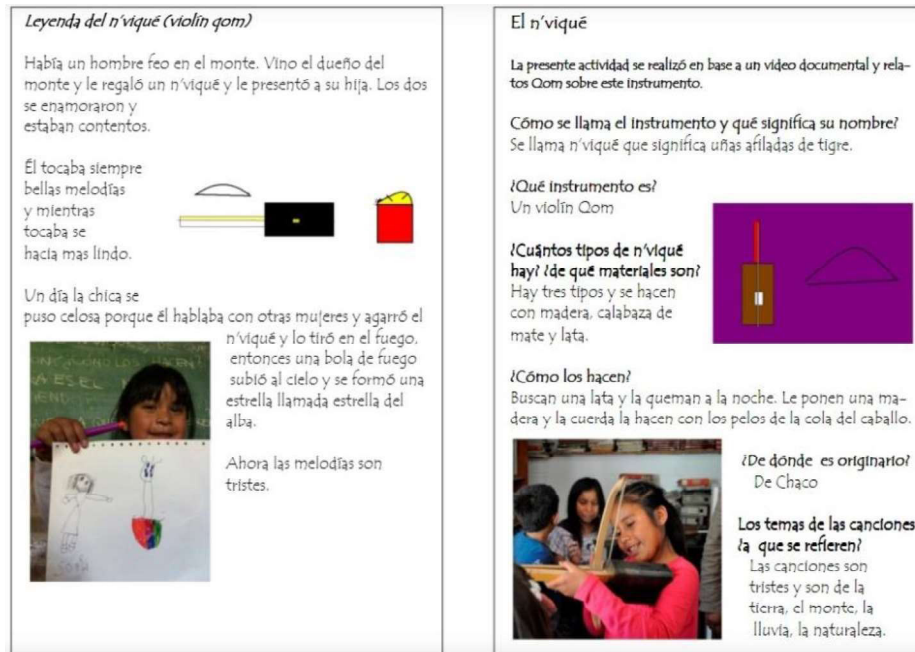
Fig 1. Leyenda N'vique.