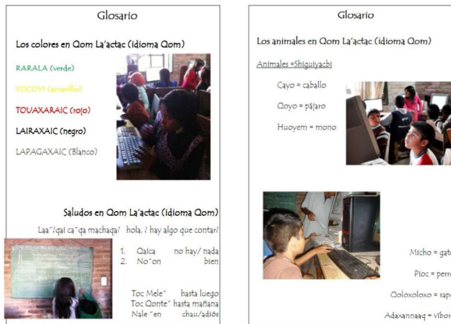
Fig. 2. Glosario.