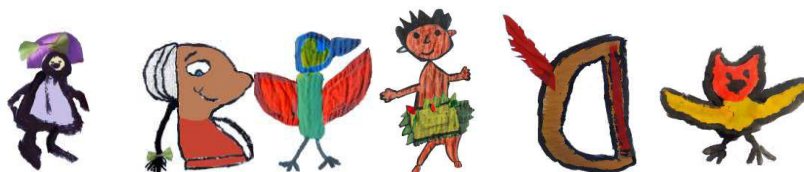
Fig. 6. Algunos personajes realizados en el taller de pintura.

En la tercera etapa, los niños y las niñas utilizaron una aplicación de programación llamada Scratch para realizar la animación. Scratch es un lenguaje de programación visual, destinados a niños, niñas y adolescentes que los introduce en el mundo de la programación y les permite, de manera intuitiva, utilizar bloques, realizar sus propias animaciones, historias interactivas, juegos, etc., a la vez que promueve el pensamiento creativo, el trabajo colaborativo y el razonamiento sistemático. Los proyectos se desarrollaron en las versiones 1.4 y 2.0 de Scratch.