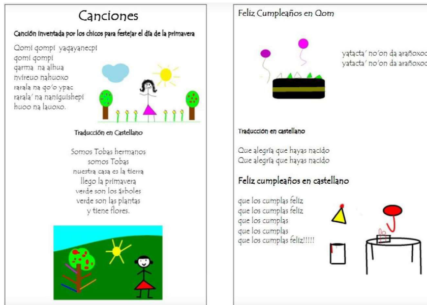
Fig. 4. Canciones.