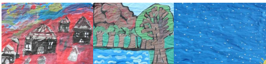
Fig. 5. Algunos escenarios realizados en el taller de pintura.

En la segunda etapa, coordinado por el otro proyecto de extensión, los niños y las niñas utilizaron la plástica para darle forma a sus personajes y escenografía. Trabajaron en grupo experimentando colores, el uso del espacio de la hoja y coordinaron con sus pares la elección de la imagen. Trabajaron con témperas, de colores primarios, blanco y negro, pinceles de distintos tamaños y otros elementos como telas, lanas, botones, entre otros, que aportaron textura a las creaciones. Como resultado final de estas jornadas se obtuvieron producciones de los escenarios (fig. 5) y personajes (fig. 6) de la leyenda que, al finalizar las actividades fueron fotografiadas para poder ser utilizadas en el taller de informática.