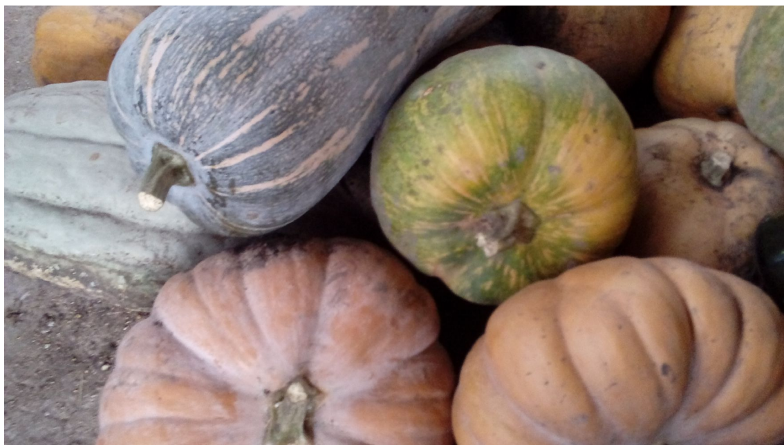
Fig. 3. Distintas variedades de Cucurbita moschata cultivadas en el PPI.