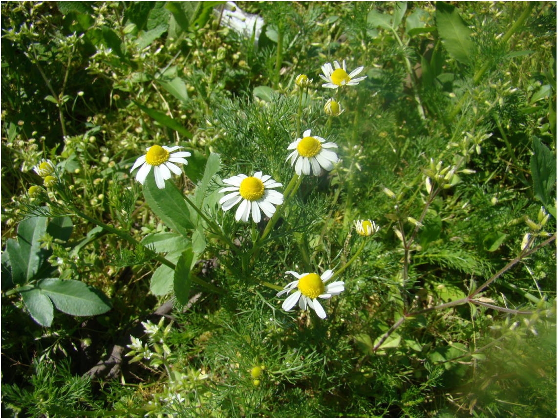
Fig. 4. “Manzanilla” ( Matricaria chamomilla ) de uso terapéutico en PPI.