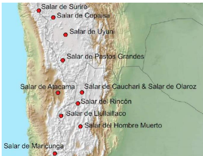
Mapa N°1. Ubicación de los salares de mayor importancia en el Triángulo del Litio

Argentina es el segundo mayor poseedor de recursos de litio a nivel mundial. Posee el 24,9% de los recursos mundiales de litio y junto con Bolivia (27,1%) y Chile (12,4%) forma parte del llamado “Triángulo del litio” (véase el Mapa N° 1), región donde los salares altioplánicos concentran el 65% del litio del planeta (MDPA, 2021). Razón, esta, que hace de la zona un territorio estratégico y, por ende, en disputa por el acceso y disponibilidad sobre sus preciados recursos naturales por parte de las grandes potencias y sus transnacionales.